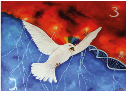
La Colombe de TESLA. Œuvre de Danièle BIGANZOLI

Si le soleil, dans le ciel, est la source de la lumière électromagnétique, quelle est la Source du Fleuve de bosons Z ? C'est peut-être le Cœur Cristallin au centre de la Terre qui, en tant que cristal unique, doit émettre des sons et composer le grand Opéra toujours cité par les sages et les poètes. Pourquoi et comment le savaient-ils ? Peut-être le percevaient-ils. Un effet de cet Opéra pourrait bien être notre posture verticale qu'on ne peut maintenir qu'à l'état de veille et pas lors du sommeil . Seul un flux provenant du centre de la Terre peut se propager verticalement sur toute la superficie de la planète. Invisible pour nos instruments de mesure, le flux des bosons peut " distinguer le bon grain de l'ivraie ", animer les grosses molécules organiques qui composent tous les organismes et pas les métaux légers qui souvent les polluent. Grâce à nos cellules gliales nous pouvons nous distinguer des autres mammifères, non seulement par la station debout, mais aussi par notre sensibilité particulière aux émotions , souvent paralysée par la peur de les exprimer et quelquefois susceptible d'exploser à cause de la rage qui accompagne cette peur.