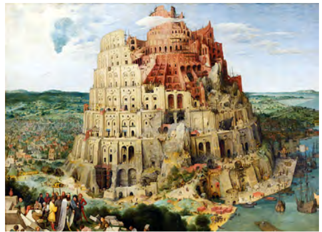
Peter Brueghel l'ancien - La tour de Babel, Vienne

atome de tout autre et cache la Lumière « faible » qui a une énergie beaucoup plus élevée que celle du champ fort . L'accélération de l'expansion de l'univers est un effet des observations astronomiques limitées à la lumière électromagnétique, donc aux effets apparents du 1%. La lumière faible est en train de modifier 99% de la masse de chaque corps, céleste et terrestre, des protons ou des « briques » présumées. Ce n'est pas la fin du monde, mais seulement celle de la Babel qui a fait de ce monde un enfer.