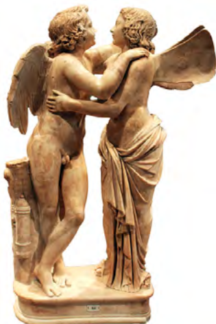
Amour et Psyché, sculpture romaine du II e siècle, Musée Altes • Berlin

Un mythe ? Oui, mais pas seulement ! Aussi, une fin heureuse qui peut nous impliquer tous.